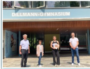
68. Europäischer Schülerwettbewerb - das Dillmann Gymnasium