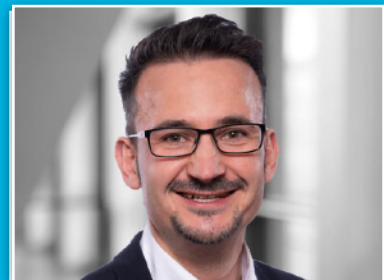
Dr. Anna Christmann